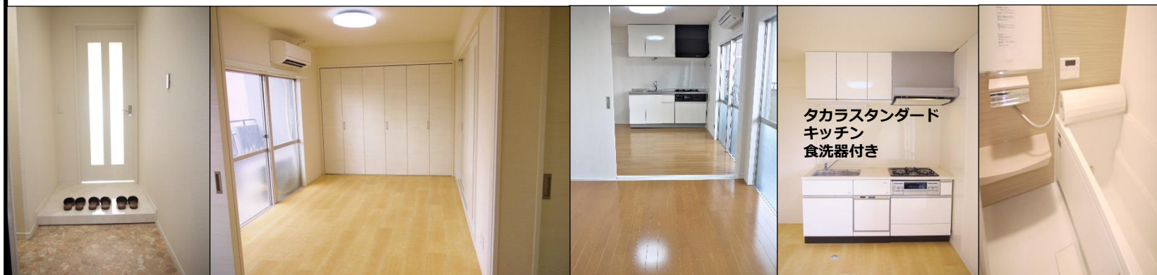
タカラスタンダード キッチン 食洗器付き