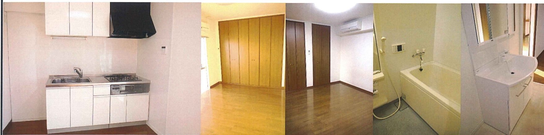
※図面と現況が異なる場合は、現況優先とさせていただきます。