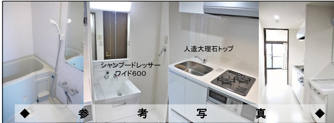
◆ 参 考 写 真 ◆