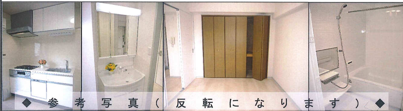
◆ 参考写真 ( 反転になります ) ◆