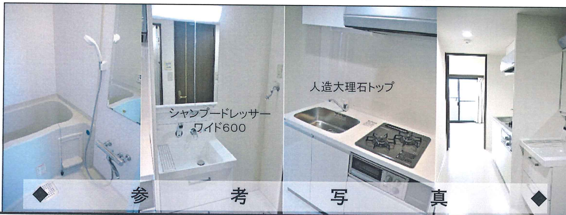
参 考 写 真