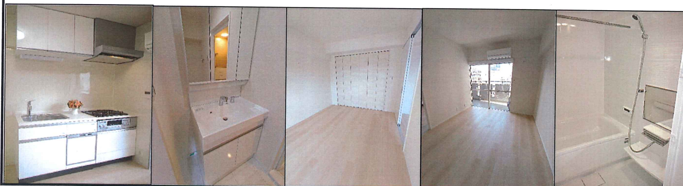
※図面と現況が異なる場合は、現況優先とさせていただきます。