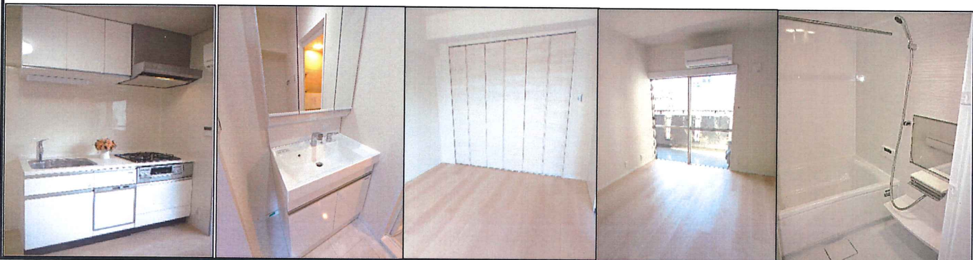
※図面と現況が異なる場合は、現況優先とさせていただきます。